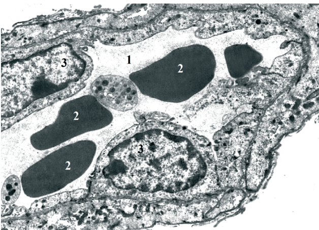
Рис. 1. Електроннограма гемокапіляра яєчка щура через 3 доби після струмектомії. \times 18000 . Просвіт гемокапіляра (1), еритроцити (2), ядра ендотеліоцитів (3).

З 7 по 14 добу експериментального спостереження виявлені попередньо електронно-мікроскопічні зміни структур гемомікроциркуляторного русла продовжували наростати. Це підтверджувалося подальшим розширенням просвітів та помітним кровонаповненням мікросудин. Зберігалися випинання і інвагінації цитоплазми ендотеліоцитів, однак товщина їх цитоплазми, особливо у периферійних відділах, дещо зменшувалася. Кількість органел також ставала меншою, а самі вони мали переважно периферійне розташування (рис. 2). Разом з тим, у цитоплазмі досить часто можна було спостерігати розширення каналців ендоплазматичної сітки і формування різних розмірів вакуолей. В ядрах спостерігалася помітна маргінація хроматину. Водночас, іноді у стромі органа можна було спостерігати гемокапіляри з вузькими просвітами.