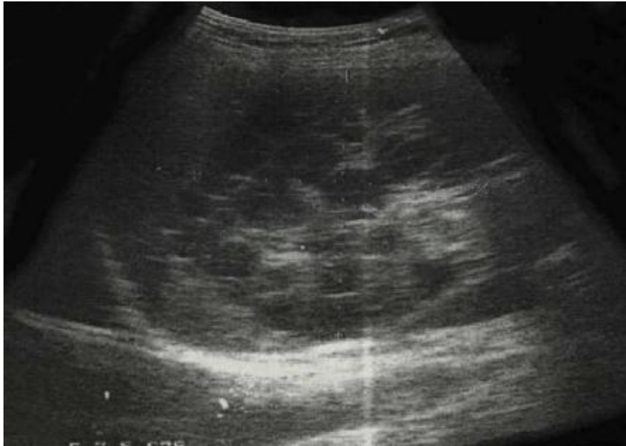
Рис. 2. УЗИ картина дочерних пузырей.

симптом характерен для локализации кисты на диафрагмальной поверхности печени.