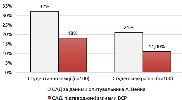
Рис. 1. Синдром автономних дисфункцій, виявлений серед досліджуваних груп.

Результати й обговорення. За даними опитувальника А. М. Вейна, ознаки вегетативних змін серед студентів-іноземців мали 32 студенти (32 %) (результат за опитувальником від 16 до 49 балів при нормі \leq 15 ), а серед українців – 21 (21 %). Однак об'єктивно наявність автономних дисфункцій, підтверджених показниками варіабельності серцевого ритму, серед іноземців мали лише 18 осіб – 18 % відповідно до загальної кількості опитаних студентів або 56,25 % відповідно до даних опитувальника. Серед студентів-українців цей показник склав 11 студентів, тобто 11 % відповідно до загальної кількості опитаних студентів або ж 52,38 % відповідно до даних опитувальника (рис. 1).