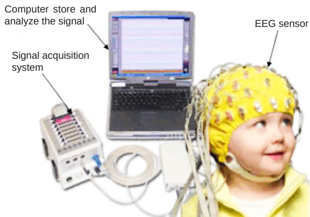
Рис. 1. Реєстрація сигналів електроенцефалографії дитячого мозку [9].

трод, який і реєструє активність м'язів у спокої і при скороченні. Електроміографія дає можливість підтвердити клінічний діагноз, проводити моніторинг перебігу та лікування захворювання, а також для надання реабілітаційних послуг.