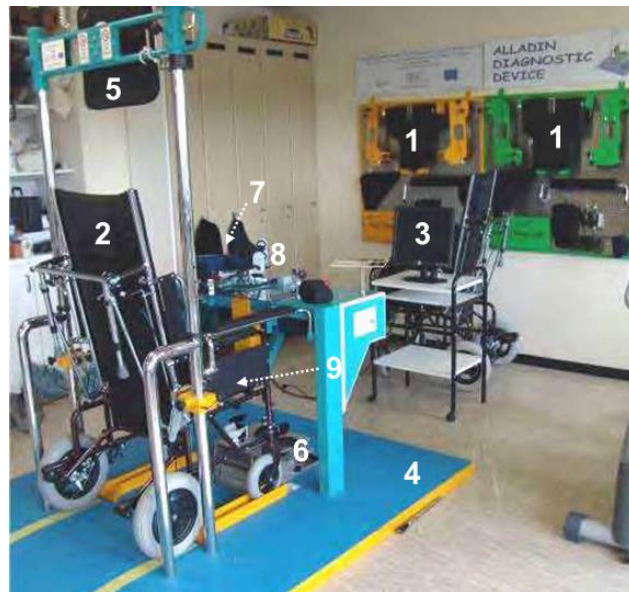
Рис. 3. Компоненти діагностичного пристрою ALLADIN.

Для прикладу представлено діагностичний прилад ALLADIN (рис. 3), який включає дев'ять компонентів, і який використовують у нейрореабілітації для оцінки постінсультного функціонального відновлення. Пристрій включає базу даних, в якій зберігаються усі функціональні показники та інші клінічні показники пацієнта [7, 8, 33, 34].