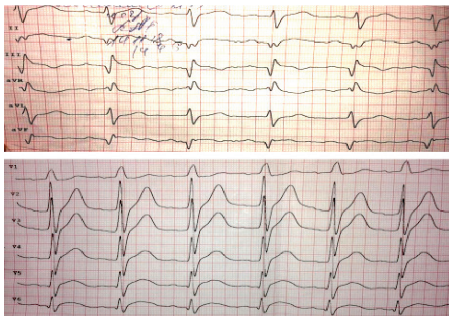
Рис. 1. Електрокардіограма пацієнта П. (14.11.2018 р.).

Враховуючи вищеописані клінічні та лабораторно-інструментальні дані, пацієнту поставлено діагноз гострого коронарного синдрому з елевацією сегмента ST та призначено подвійну антитромбоцитарну терапію (“Кардіомагніл”, “Тикагрелор”), “Клексан” по 0,8 мл двічі на добу, статини (“Розувастатин” у дозі 40 мг на добу), “Еплеренон” (“Інспра”) по 25 мг/добу, антиангінальну (“Метопролол” у дозі 100 мг на добу) та гіпотензивну терапії (“Лізиноприл” в дозі 20 мг на добу). Протягом