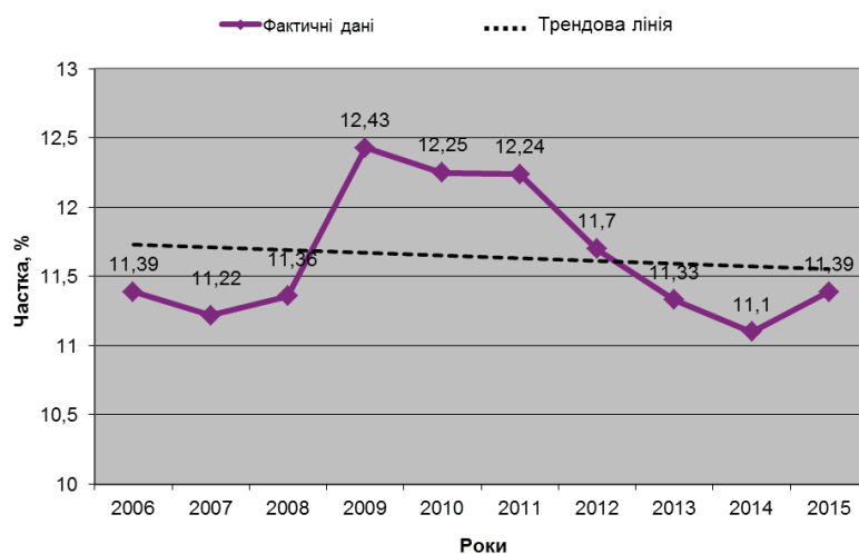
Рис. 2. Динаміка частки дітей, народжених із великою масою тіла в загальній структурі у Львівській області за період 2006–2015 рр.

3. Частота народження хлопчиків із великою масою тіла в усіх вагових категоріях достовірно є вищою ( p < 0,05 ), ніж народження дівчаток з великою масою тіла протягом усього 10-річного періоду спостереження.