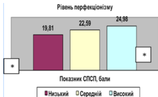
Рис. 2. Показник СПСП у студентів із різним рівнем перфекціонізму. Примітка. * – відмінності достовірно порівняно з іншими групами, p < 0,05 .

Встановлено, що показник СПСП позитивно корелював з П2 ( R = 0,19 , p = 0,002 ), П3 ( R = 0,26 , p = 0,001 ), П5 ( R = 0,14 , p = 0,02 ) (зв'язки слабкі) та П1 ( R = 0,31 , p = 0,001 ), П4 ( R = 0,33 , p = 0,001 ) (зв'язки середньої сили). Знайде-