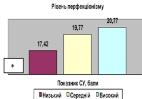
Рис. 3. Показник СУ в студентів із різним рівнем перфекціонізму. Примітка. * – відмінності достовірно порівняно з іншими групами, p < 0,01 .

Таким чином, серед студентів ВМЗ достовірно переважали особи з домінуючою адаптивною СВП, другою за