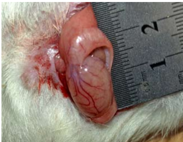
Рис. 1. Яєчко інтактного щура.

( 2,19 \pm 0,03 ) \text{cm}^3 відповідно. Яєчко мало щільну консистенцію, форма його наближалась до яйцеподібної, при цьому орган був дещо сплюсненим з боків.