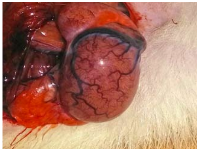
Рис. 3. Гіперемія яєчка на третю добу стенозу сім'яного канатика.