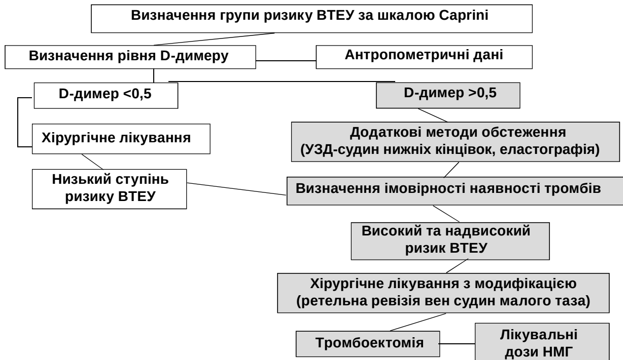
Рис. 2. Алгоритм оптимізації діагностичної та хірургічної тактики у хворих на рак ендометрія з урахуванням ризику можливих венозних тромбоемболічних ускладнень.

та антропометричних даних конкретної хворої на РЕ для передбачення ймовірності тромбозу в венах малого таза.