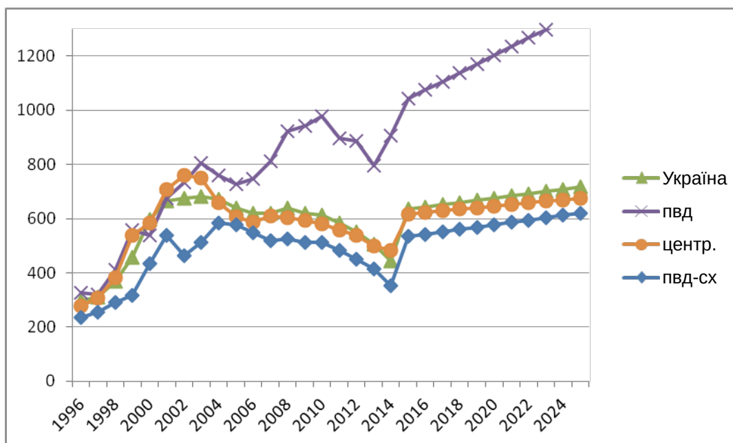
Рис. 2. Прогноз захворюваності на стенокардію в Україні та районах до 2025 року (на 100 тис. нас.)

3. Поширеність ІМ в Україні зросла у 2014 р. порівняно із 1996 р. на 96,4%. Найістотніше вона збільшилася у Центральному (у 1,4 разу) та Північно-Східному (у 1,2 разу) районах України.