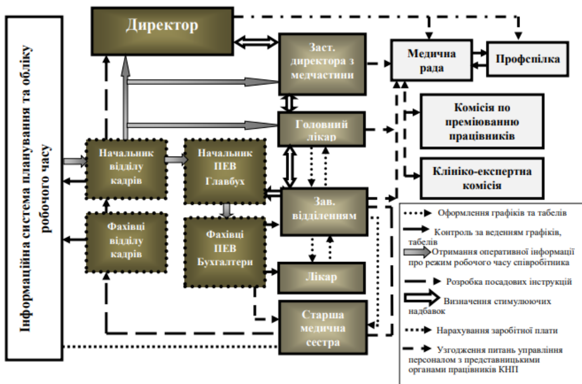
Рис. 2. Організаційна схема реалізації комплексу заходів, спрямованих на оптимізацію управління медперсоналом медичної організації.

Ці заходи спрямовані на покращення якості управління медичним персоналом і можуть значно поліпшити функціонування медичної організації (рис. 2).