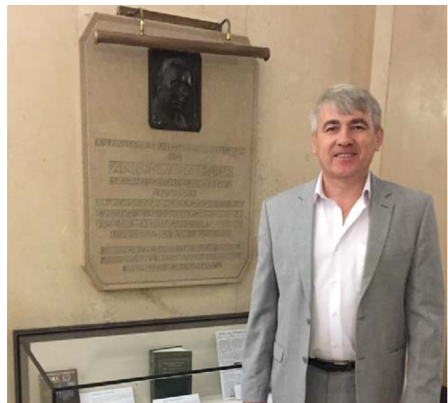
Проректор ТДМУ вивчав підготовку магістрів громадського здоров'я