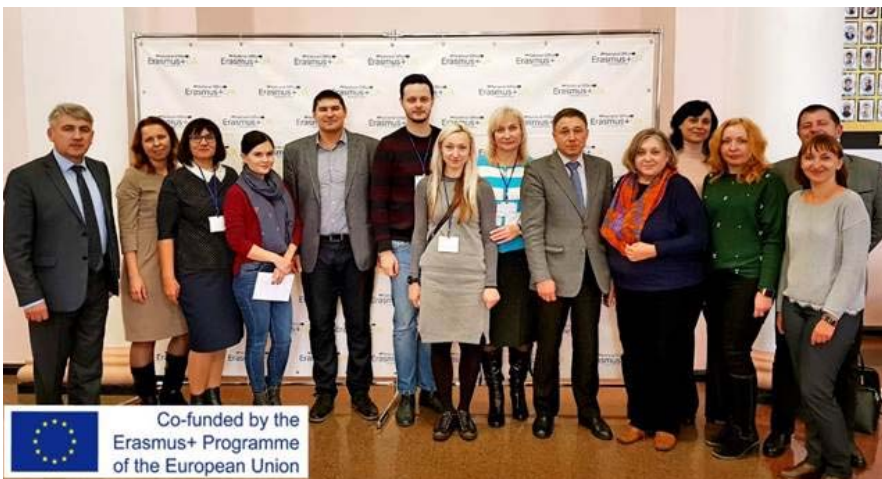
Делегація ТДМУ взяла участь у семінарі-тренінгу для переможців конкурсу Еразмус+

ситетом імені Т. Шевченка та Київським університетом імені Б. Грінченка [5].