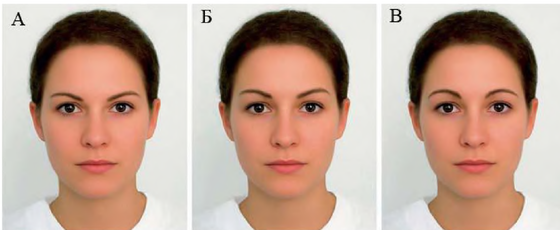
Рис. 2. Різні варіанти форми та висоти положення брів.

Найбільша частина цих жінок була із вікових груп 30–39 та 40–49 років. Слід зауважити, що люди, старші 50 років, віддавали перевагу високо розташованим бровам із максимальною висотою у середній третині. Мабуть, це зумовлено модою на таку форму брів у 60–70-ті роки минулого сторіччя, коли вони були молоді.