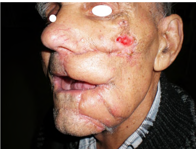
Рис. 4. Хворий через місяць після операції (09.11.2009).

Отже, одномоментне використання двох транспозиційних клаптів, сформованих у прилеглих до великого дефекту обличчя ділянках, дає змогу домогтися позитивного реконструктивного результату без застосування багатоетапних хірургічних втручань. Клапоть, який містив у собі підшкірний м'яз шиї і підшитий до дефекту нижньої губи, не атрофується і з часом є добрим функціональним бар'єром для їжі.