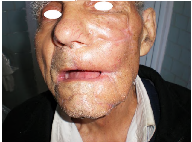
Рис. 5. Функціональний результат через шість місяців (12.04.2010).