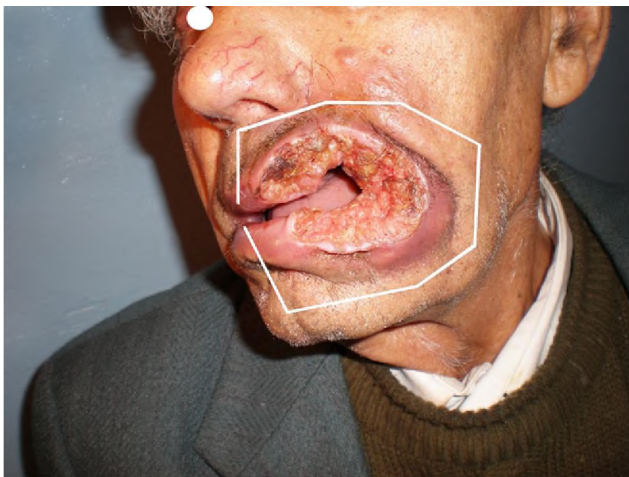
Рис. 1. Масивний рецидив плоскоклітинного раку обох губ, лівої щоки і контури радикальної резекції (13.10.2009).

Анамнез хвороби. У 2007 році з приводу плоскоклітинного раку шкіри верхньої губи зліва