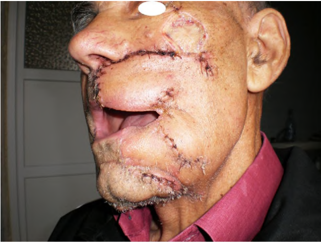
Рис. 3. Результат пластики верхньої і нижньої губи з формуванням лівого кута рота (через два тижні після операції, 26.10.2009).

Таким чином, між двома транспозиційними клаптями з різнонаправленими векторами силових ліній був сформований кут рота. Маючи незалежне кровопостачання, кожен з клаптів залишався життєздатним. Післяопераційний період минув без ускладнень, на 11-й день після операції хворий був виписаний зі стаціонару. Перебував на диспансерному нагляді протягом чотирьох років. Безпосередні та віддалені косметичні результати онкопластичної операції були задовільними (рис. 4 і 5). Функції мовлення та ковтання відновлені.