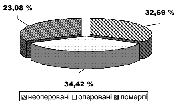
Рис. 1. Частота помилкових діагнозів на догоспітальному етапі.

Результати досліджень та їх обговорення. Вік хворих коливався від 17 до 83 років, однак більшість пацієнтів (65,02 %) була працездатного віку. Хворих чоловічої статі було 67, жіночої – 136. Частота помилкових діагнозів на догоспітальному етапі у хворих на ГНК в досліджуваних групах наведена на рисунку 1.