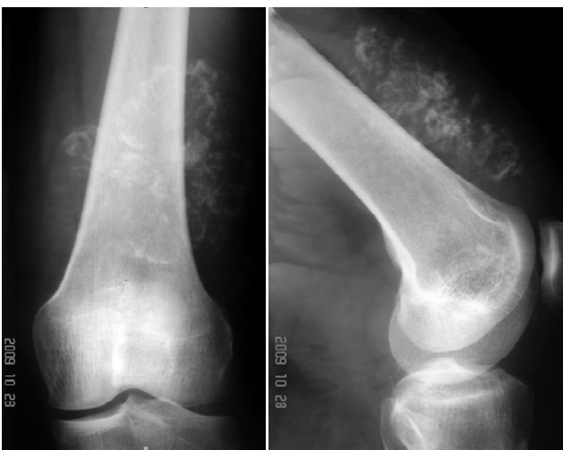
Рис. 2. Пацієнтка Д., 24 р. Рентгенограми лівого колінного суглоба, виконані у передньо-задній та боковій проекціях.

На рентгенограмах лівого колінного суглоба, виконаних у передньо-задній та боковій проекціях (рис. 2), визначається: дистальний метаепіфіз стегнової та проксимальний метаепіфіз великогомілкової кістки не змінені. Відзначається незначно виражений субхдральний склероз медіального виростка великогомілкової кістки, суглобова щілина симетрична, міжвиросткові підвищення дещо загострені. В проекції верхніх медіального та латерального заворотів колінного суглоба визначаються неправильної форми з нечіткими контурами ділянки звапнення. У боковій проекції проксимальніше ділянки звапнення – реакція окістя у вигляді періостозу. Кортикальні шари нижньої третини стегнової кістки без видимих дефектів.