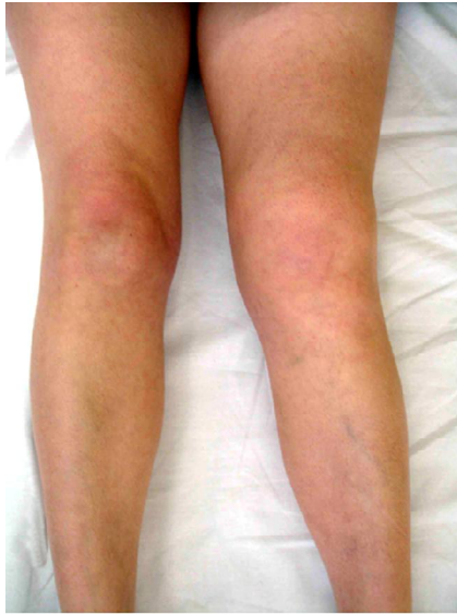
Рис. 1. Пацієнтка Д., 24 р. Зовнішній вигляд лівого колінного суглоба при первинному огляді.

На рентгенограмах лівого колінного суглоба, виконаних у передньо-задній та боковій проекціях (рис. 2), визначається: дистальний метаепіфіз стегнової та проксимальний метаепіфіз великогомілкової кістки не змінені. Відзначається незначно виражений субхдральний склероз медіального виростка великогомілкової кістки, суглобова щілина симетрична, міжвиросткові підвищення дещо загострені. В проекції верхніх медіального та латерального заворотів колінного суглоба визначаються неправильної форми з нечіткими контурами ділянки звапнення. У боковій проекції проксимальніше ділянки звапнення – реакція окістя у вигляді періостозу. Кортикальні шари нижньої третини стегнової кістки без видимих дефектів.