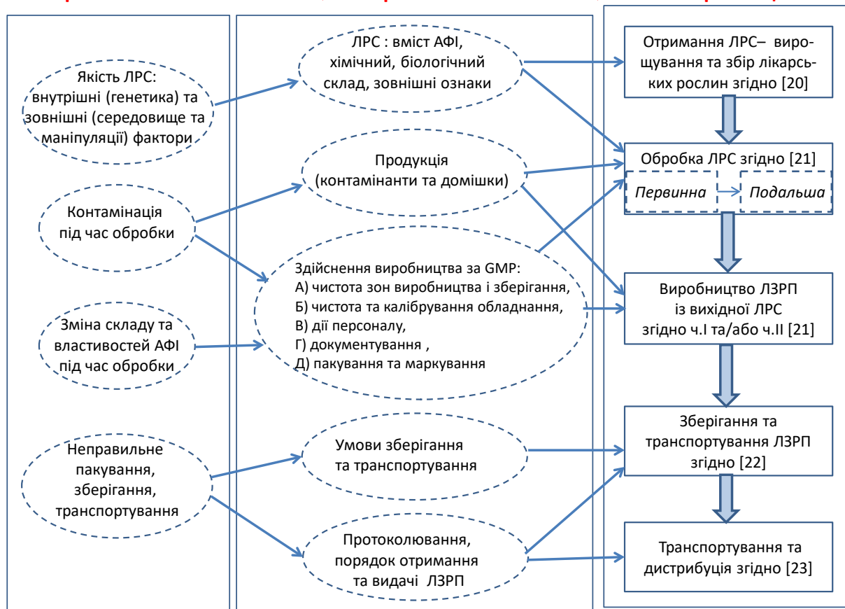
Рис. 2. Елементи забезпечення якості ЛЗРП та основні етапи їх виробництва.