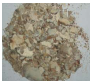
Подрібнена біомаса F. velutipes (тривалість подрібнення – 5 с)