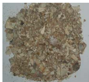
Подрібнена біомаса F. velutipes (тривалість подрібнення – 10 с)