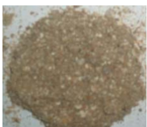
Подрібнена біомаса F. velutipes (тривалість подрібнення – 25 с)