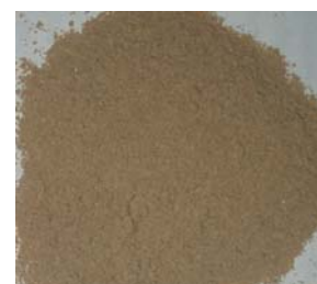
Подрібнена біомаса F. velutipes (тривалість подрібнення – 35 с)