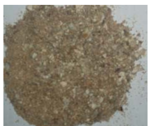
Подрібнена біомаса F. velutipes (тривалість подрібнення – 20 с)