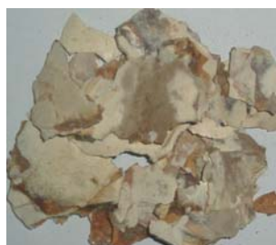
Неподрібнена біомаса F. velutipes

Результати визначення фракційного складу СПБ F. velutipes наведено в таблиці 1.