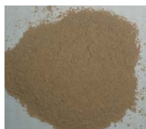
Подрібнена біомаса F. velutipes (тривалість подрібнення – 30 с)