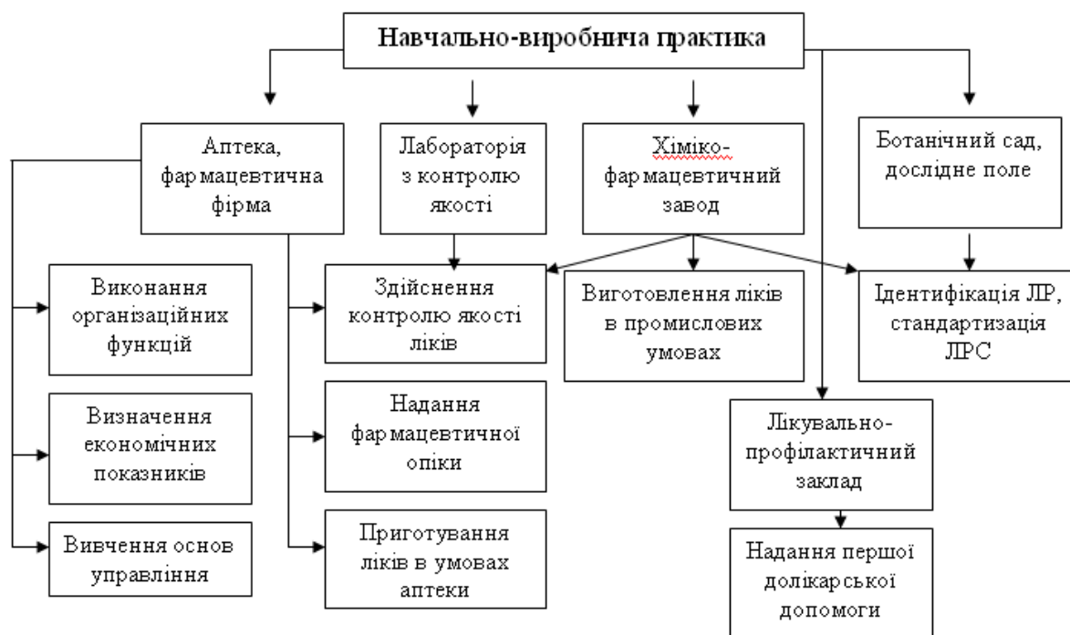
Рис. 3. Напрямки навчально-виробничої практики студентів зі спеціальності "Фармація".

Професійну спрямованість змісту навчально-виробничої практики представлено на рис. 3.