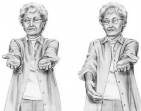
А Б Рис. 1. Для виявлення парезів кінцівок хворий повинен утримати витягнуті вперед руки (А), швидше опуститься паретична (уражена) рука (Б).

Тест 1. Попросіть хворого потримати витягнуті вперед руки протягом 10 секунд (рис. 1, А), швидше опуститься уражена рука (1, Б). У разі повної паралізації хворий взагалі не зможе утримувати руку перед собою.