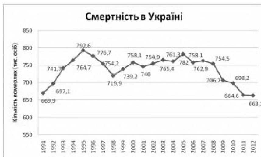
Рис. 1. Динаміка смертності населення України.