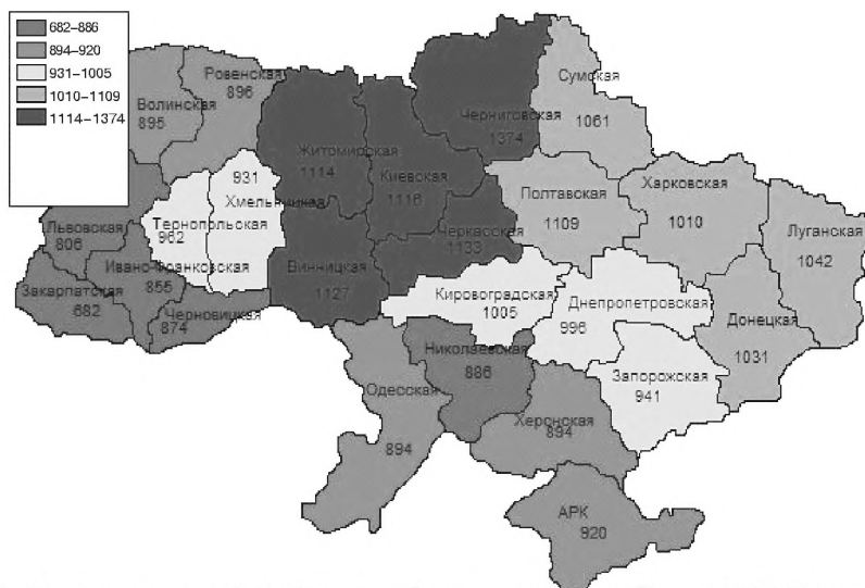
Рис. 5. Загальна смертність від хвороб системи кровообігу на 100 000 населення за 2012 рік.

екологічною ситуацією та спокійнішим ритмом життя, пов'язаним з більш аграрною спрямованістю господарства цих областей.