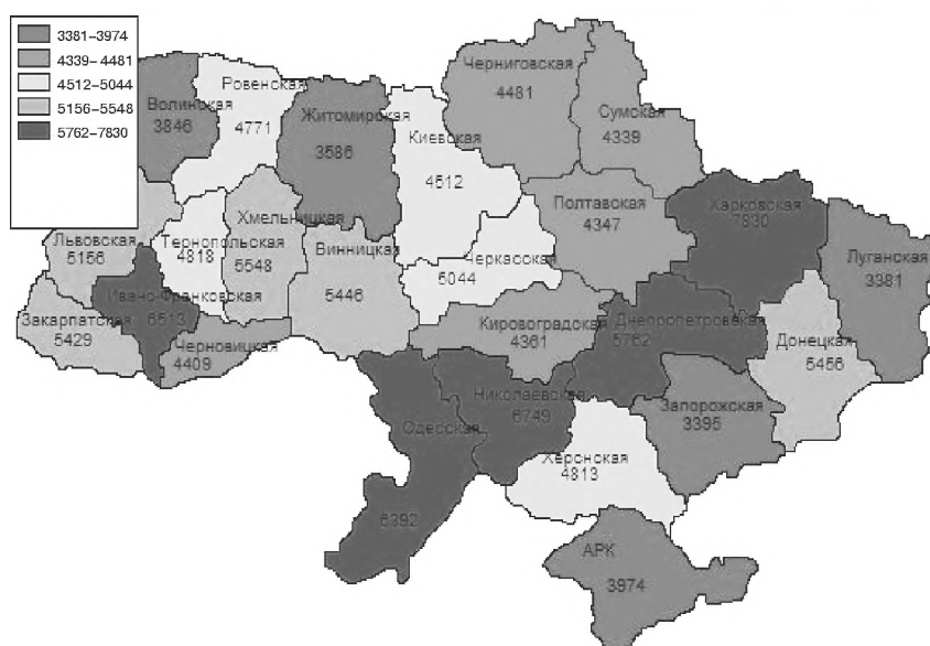
Рис. 4. Первинна захворюваність на хвороби системи кровообігу на 100 000 населення у 2012 році.