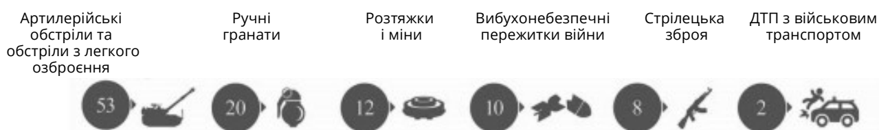
Рис. 2. Структура причин жертв серед цивільного населення.

Після 1 липня, коли набрало чинності «хлібне перемир'я», чисельність жертв серед цивільного населення значно скоротилася, демонструючи важливість узгоджених зусиль із забезпечення стійкого припинення вогню [5].