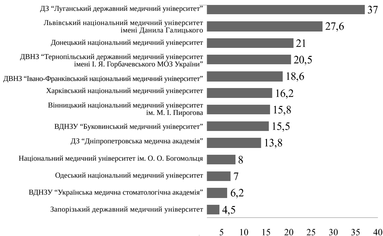
Рис. 1. Кількість вступників із балами менше 150, рекомендованих до зарахування до медичних вишів у 2017 році.

Варто наголосити, що в Рейтингу закладів вищої освіти України за Індексом прозорості антикорупційної політики (ІПАП-2017) [11], набравши 18 балів і здобувши 62,07 % рівня прозорості (РП, максимальний РП був оцінений у 83,62 %), академія посіла 11 місце серед 165 вищих навчальних закладів і фактично 4 місце серед ВМ(Ф)НЗ, поступившись трьома ЗВО, які перебувають у підпорядкуванні МОЗ: Тернопільському державному медичному університету імені І. Я. Горбачевського – 20,5 б. і 2 місце в загальному рейтингу (70,69 % РП), Одеському національному медичному університету – 18,5 б. і 7 місце в загальному рейтингу (63,79 % РП) та Національному фармацевтичному університету – 18,25 б. і 10 місце в загальному рейтингу (62,93 % РП).