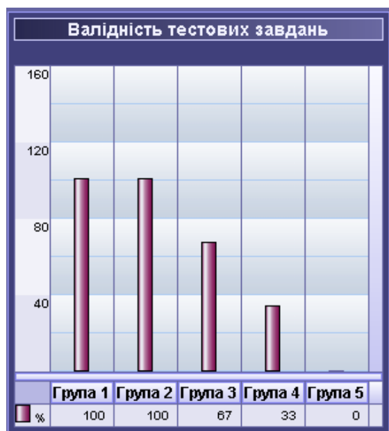
Рис. 1. Гістограма успішності відповідей на валідне запитання.

( i=1, \dots, n; j=1, \dots, m ). Використано дихотомічну шкалу оцінювання результатів тестування, при якій можливі оцінки склалися з двох елементів \{0; 1\} : 0 – завдання не виконане, 1 – завдання виконане правильно. Процес статистичної обробки матриці результатів відбувався по кроках.