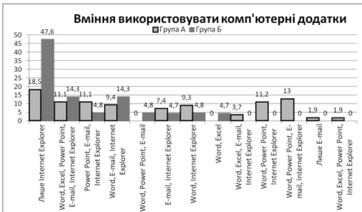
Рис. 4. Вміння застосовувати користуальницькі додатки і комп'ютерні інструменти (у %).

вчання (57%), в той час як група А виділила важливим більше роботи на ПК та навчання через Інтернет (52%). 76% відповіли, що, на їх думку, інформаційні технології базуватимуться в майбутньому на