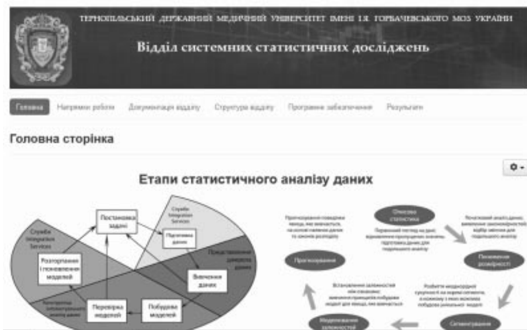
Рис. 4. Головна сторінка Web-сайту відділу.