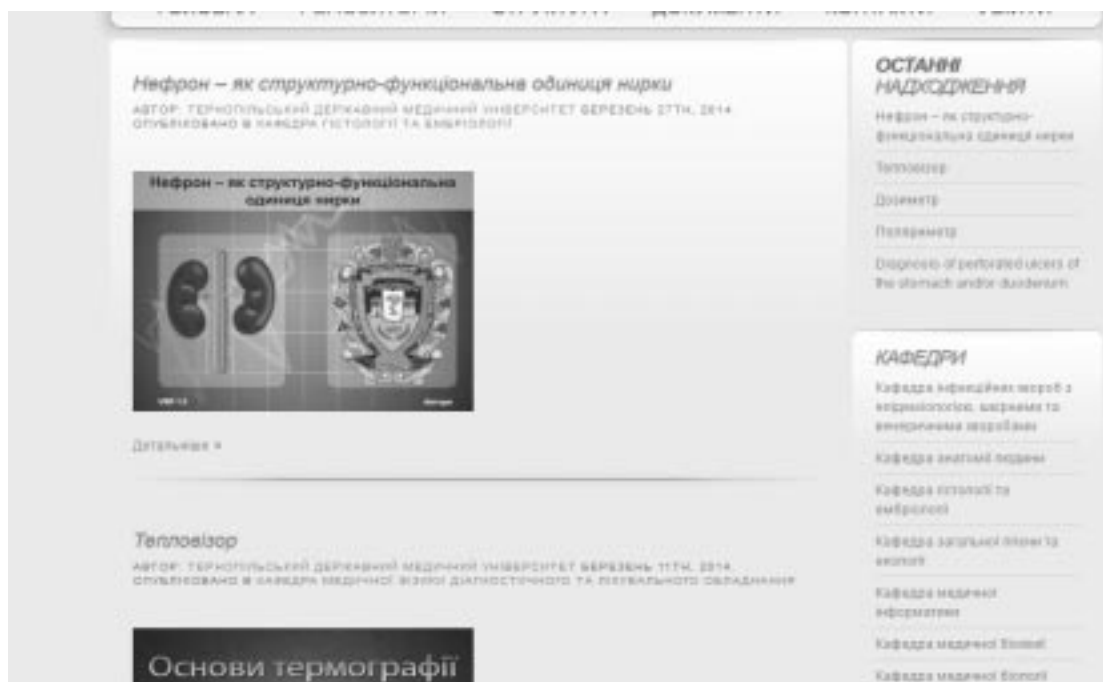
Рис. 3. Вкладка РЕПОЗИТОРІЙ на сайті відділу віртуальних навчальних програм.

На головній сторінці сайту відділу навчальних відеофільмів http://dms.tdmu.edu.ua/films/ у розділі ВІДЕО ТДМУ містяться новостворені відділом фільми, а у вкладці НАВЧАЛЬНІ ВІДЕОФІЛЬМИ – архів усіх існуючих (в т. ч. оцифрованих) навчальних відеофільмів, стосовно конкретної кафедри.