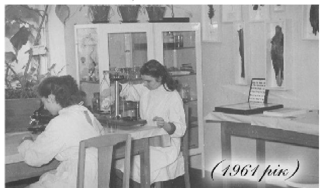
Співробітники кафедри під час виконання фрагментів науково-дослідної роботи