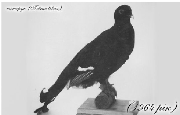
Спудкага тварин, виготовлені своєю І.І. Яременко.