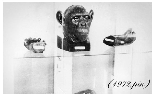
Результати експозиції «Біологія людини» навчально-біологічного музею