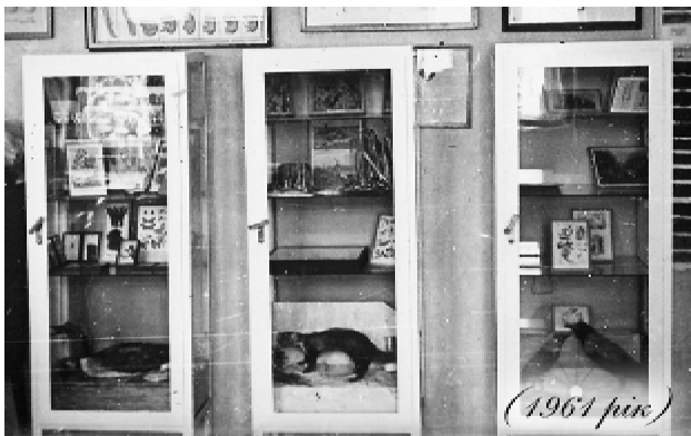
Загальний вигляд навчально-біологічного музею. Експозиція «Взаємозв'язок живої природи та довкілля»

вчально-виховному процесі повинні зайняти музеї. Це особливо має актуальне значення при вивченні однієї з фундаментальних дисциплін – біології” , – зазначав І. І. Яременко у короткому довіднику про навчальний музей, написаному ще у 1974 році. При оформленні тематики біологічного музею з понад 2000 експонатів особливу увагу Іван Іванович надав показу єдності організмів і середовища, походження живого з неживої матерії, великої різноманітності рослинного та тваринного світу, сучасних принципів побудови організмів, процесів розмноження та розвитку, питань спадковості та мінливості.