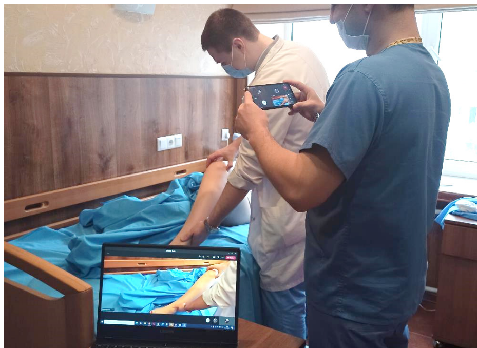
Рис. 2. Вигляд онлайн-демонстрації клінічного обстеження пацієнта.

ходу викладач повертається до кабінету, має змогу завантажити в чат засідання деперсоналізовані дані історії хвороби, рентгенограми тощо та обговорити із учасниками засідання даний клінічний випадок.