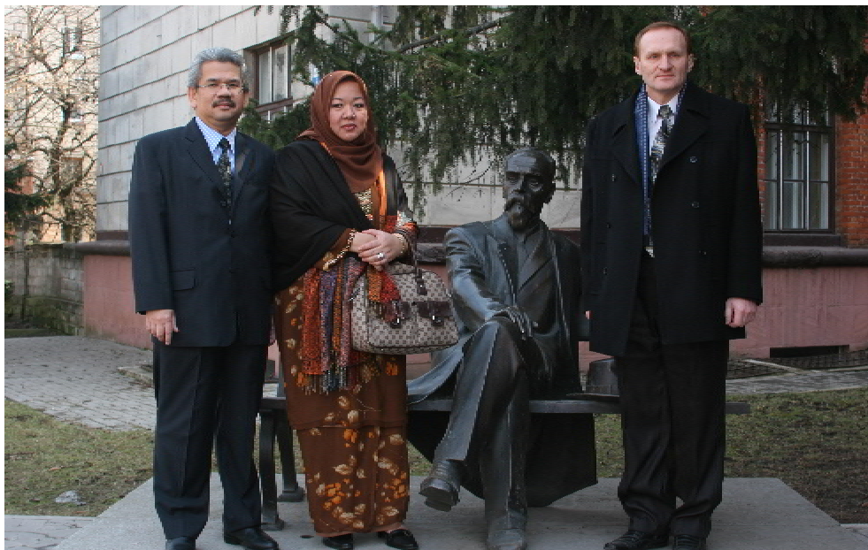
Надзвичайний і Повноважний Посол Малайзії в Україні Абдул Сані Омар з дружиною під час візиту до ТДМУ

впровадження в нашому ВНЗ, про співпрацю ТДМУ з провідними закордонними вищими медичними навчальними закладами, інші важливі аспекти університетської діяльності. Посол висловив задоволення почутим і запевнив, що в Малайзії щиро зацікавлені в співпраці з провідними ВНЗ України, зокрема з ТДМУ ім. І. Я. Горбачевського. Поважні гості оглянули морфологічний та ряд інших університетських корпусів, та побували в гуртожитку, де зустрілись з малайзійськими студентами.