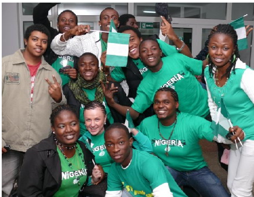
В ТДМУ навчається понад 300 студентів з Нігерії

дентів. Ректор висловив сподівання, що дана зустріч сприятиме більш тісному співробітництву у галузі освіти між двома країнами. Пан посол відмітив, що він приємно вражений умовами, створеними в університеті для іноземних студентів, і буде рекомендувати нігерійським громадянам навчатися саме в Тернопільському медуніверситеті. Після закінчення перемовин посол зустрівся з нігерійськими студентами і відвідав ряд кафедр університету.