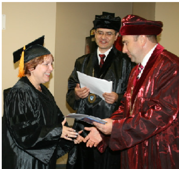
Вручення дипломів у Нью-Йорку в приміщенні компанії International Career Consulting, Inc. медсестрам-бакалаврам дистанційної форми навчання

10 липня 2011 р. відбувся перший випуск студентів дистанційної форми навчання. Проректор і декан університету у Нью-Йорку в приміщенні компанії International Career Consulting, Inc. вручили дипломи 22 медсестрам-бакалаврам, які протягом двох років навчалися в Інституті медсестринства ТДМУ на дистанційній формі.