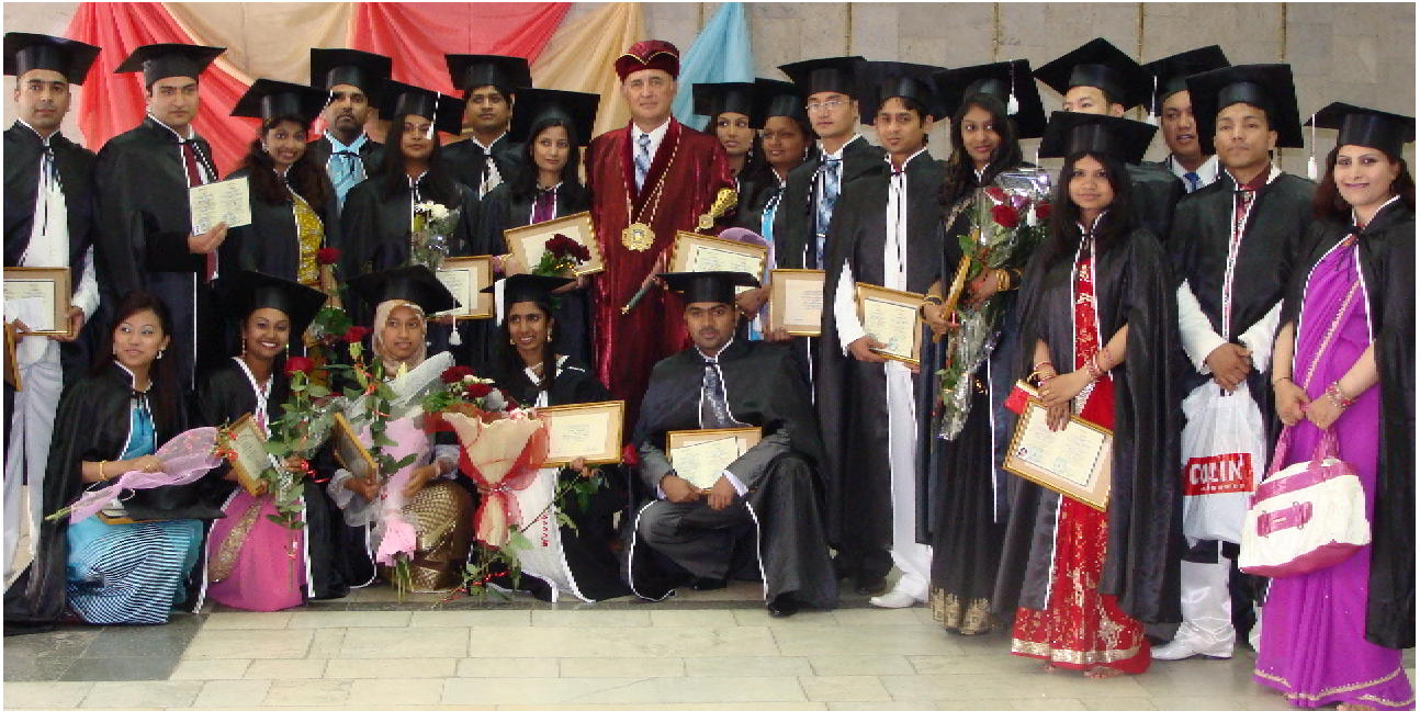
Щасливі випускники 2009 р. з ректором університету чл.-кор. НАМН України, проф. Л. Я. Ковальчуком

Університет неодноразово відвідували офіційні особи посольств і консульств ряду країн. Зокрема, 28.03.2009 р. поважними гостями ТДМУ були Надзвичайний і Повноважний Посол Малайзії в Україні Абдул Сані Омар з дружиною та перший секретар посольства Малайзії. Вони зустрілися з керівництвом університету, ознайомилися з умовами навчання і проживання іноземних студентів. В ході розмови гості отримали вичерпну інформацію про сучасні європейські методики навчання та інформаційні технології,