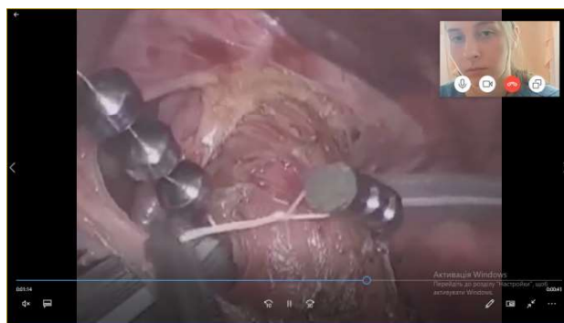
Рис. 1. Дистанційний онлайн-семінар.

Традиційним для студентів, котрі займаються на нашій кафедрі, є відвідування операційного відділення. Під час перебування обмеженої кількості студентів в операційних не завжди вдається побачити хід оперативного втручання, а також пояснити кожен деталь операції. Під час онлайн-семінару викладач має можливість провести трансляцію запису тої чи іншої операції та розібрати зі студентами її хід та різні особливості. Ба більше, студентам, як правило, можна демонструвати