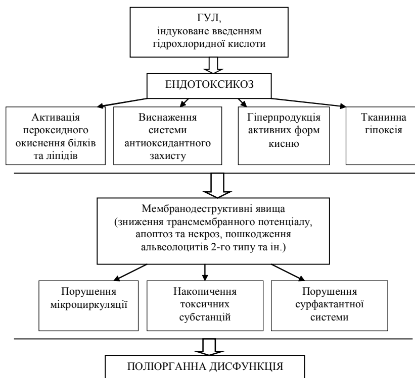
Схема. Роль ендотоксикозу в патогенезі гострого ураження легень.