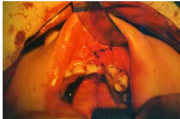
Рис. 6. Вигляд ділянки альвеолярного відростка після зашиття рани.

Висновки. 1. Діти складають значну частину пацієнтів відділення щелепно-лицевої хірургії.