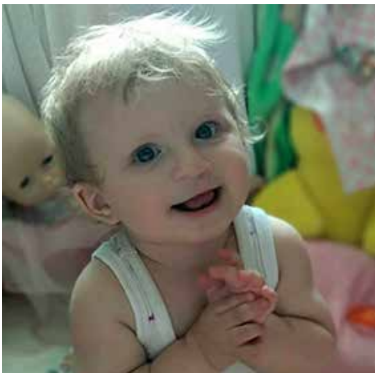
Рис. 4. Дитина через 6 місяців після хірургічного лікування.

тодику альвеолоостеопластики із застосуванням комплексного кісткового трансплантата та закриття дефекту слизовою оболонкою із вестибулярного боку альвеолярного відростка, яка забезпечує його анатомічне відновлення, створює опору для м'язів верхньої губи та крил носа, забезпечує ріст та розвиток зубо-щелепної системи та обличчя в цілому, створює стабілізуючий ефект у косметичному та функціональному аспектах на тканини верхньої губи та носа [5]. Нижче подано ілюстрацію одного із клінічних випадків застосування вказаної методики (рис. 5, 6).