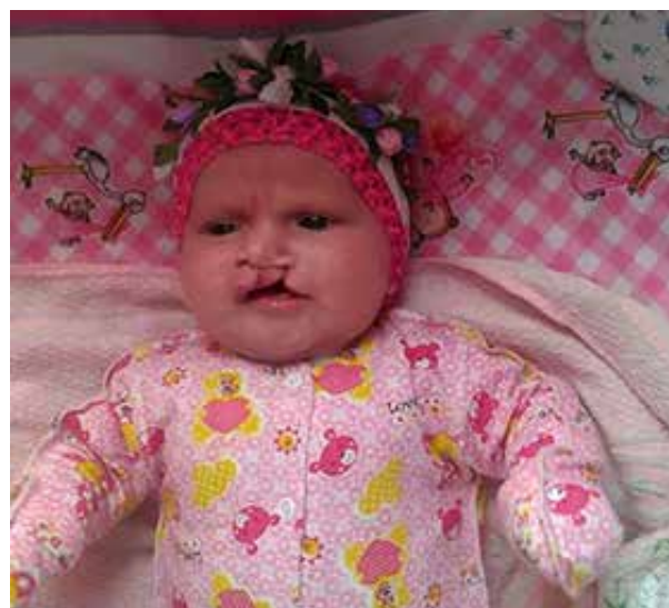
Рис. 1. Стан дитини з однобічним уродженим незрощенням верхньої губи до операції.

Важливим елементом реабілітації дітей з уродженим незрощенням піднебіння є раннє відновлення роботи піднебінно-глоткового клапана. В центрі цей етап хірургічного лікування, зазвичай, проводять у терміни 9–10 місяців та застосовують модифіковану методику І. М. Готя, яка на даний час проходить патентну експертизу. Також у центрі розроблено ме-