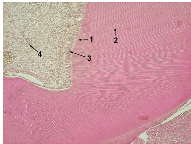
Рис. 1. Навколопульпарний дентин великого кутнього зуба чоловіка:

Результати проведених мікроскопічних досліджень декальцинованих великих кутніх зубів виявили, що структура одонтобластів та їх монопедичних відростків дещо відрізняється у чоловіків порівняно з жінками. У рогах пульпової камери в чоловіків одонтобласти мають багаторядну структуру (рис.1).