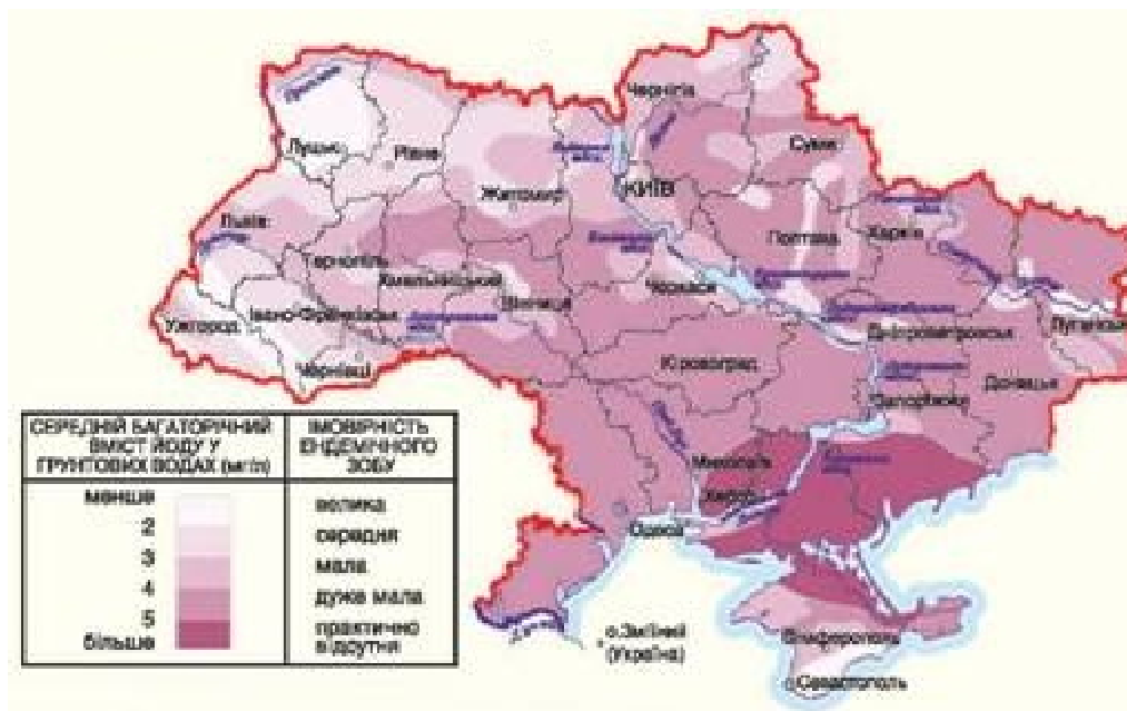
Рис. 1. Йод у ґрунтових водах.