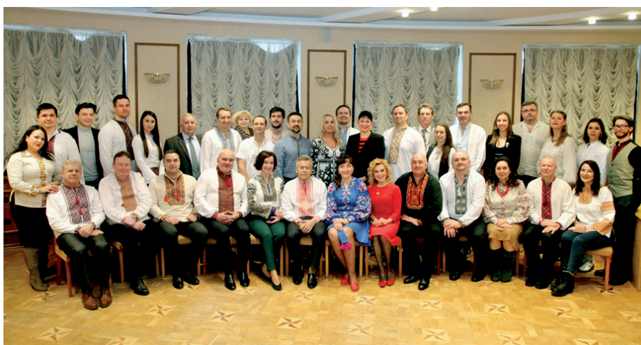
Рис. 9. Кафедра ортопедичної стоматології.

Кафедру дитячої терапевтичної стоматології та профілактики стоматологічних захворювань було створено у 1989 р. Понад 25 років її очолювала заслужений діяч науки і техніки України професор Л. О. Хоменко, а зараз очолює професор О. В. Савичук (рис. 10).