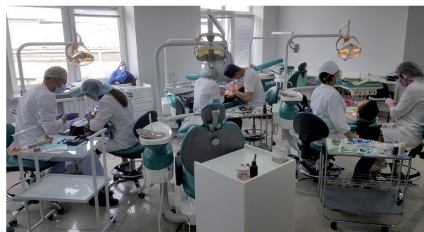
Рис. 6. Прийом пацієнтів студентами (2019 р.).

Вагомий внесок у розвиток професійної майстерності вносила Асоціація стоматологів