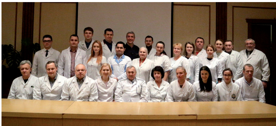
Рис. 8. Кафедра хірургічної стоматології та щелепно-лицевої хірургії.