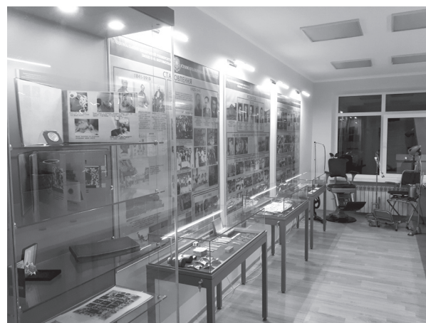
Рис. 17. Музейна експозиція у Стоматологічному медичному центрі.