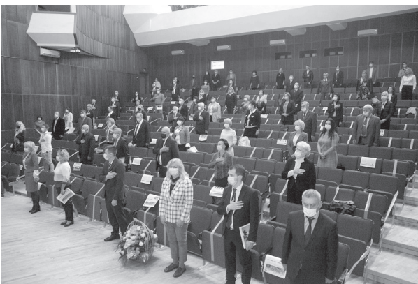
Рис. 13. Урочисті збори з нагоди 100-річчя стоматологічного факультету.

9 жовтня 2020 р. відбулися урочисті збори з нагоди 100-річчя стоматологічного факультету (рис. 13).