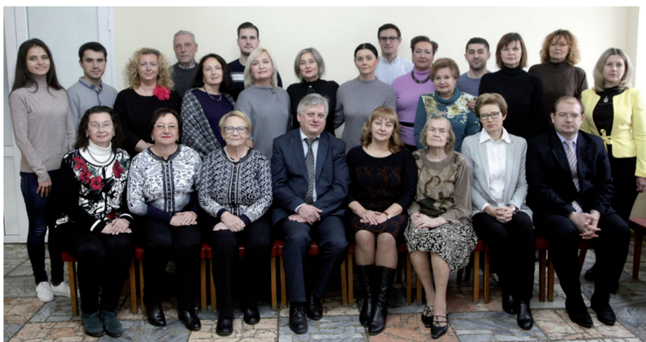
Рис. 10. Кафедра дитячої терапевтичної стоматології та профілактики стоматологічних захворювань.