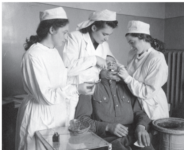
Рис. 2. Відпрацювання лікарських навичок. Прийом пацієнтів студентами Київського стоматологічного інституту (50-ті роки XX ст.).

У 1945 р. стоматологічний факультет вже вдруге був реорганізований у стоматологічний інститут. Поступово розширювалися його навчальні бази, формувалися наукові та педагогічні кадри. У 1947–1948 навчальному році в інституті навчалось близько 1000 студентів (рис. 2).