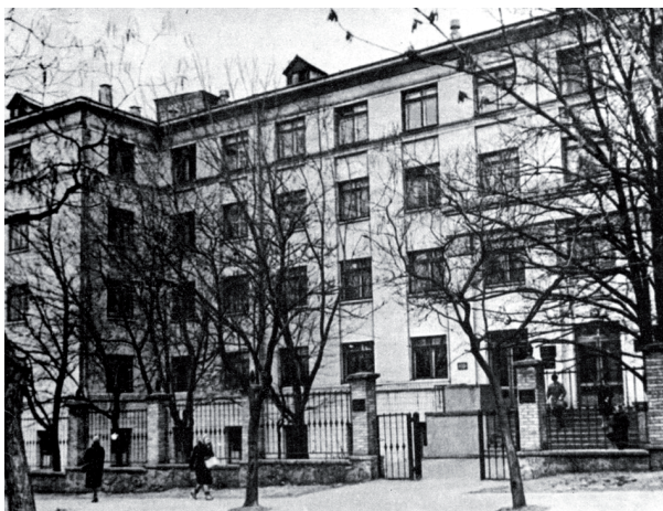
Рис. 3. Стоматологічний корпус (збудований у 1964 р.).