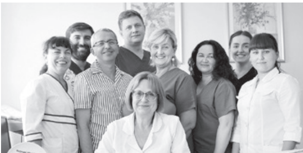
Рис. 12. Кафедра хірургічної стоматології та щелепно-лицевої хірургії дитячого віку.