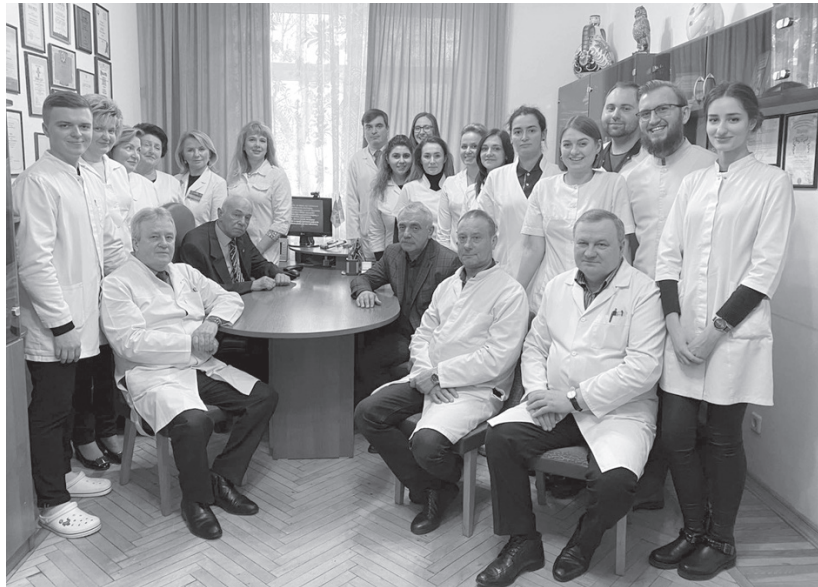
Рис. 11. Кафедра ортодонції та пропедевтики ортопедичної стоматології.

Кафедру хірургічної стоматології та щелепно-лицевої хірургії дитячого віку очолює професор Л. М. Яковенка, а до того тривалий час очолював член-кореспондент НАМН України професор Л. В. Харьков (рис. 12).