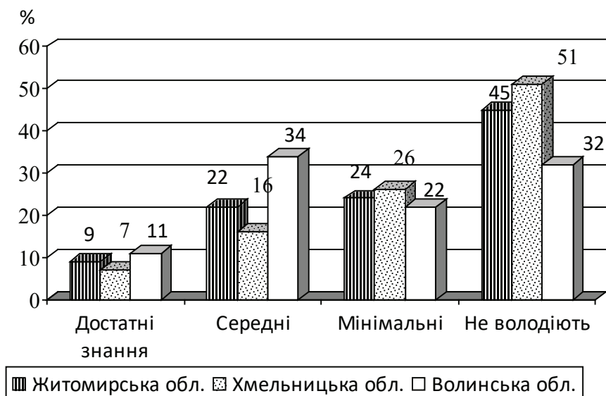
Мал. 1. Власна поінформованість про хворобу Лайма працівників лісу Житомирської, Хмельницької та Волинської областей.

Іспанії – 9,3 %, Норвегії – 16 % [10]. За нашими даними, частота серопозитивності щодо комплексу B. burgdorferi sensu lato серед зазначених працівників у Тернопільській області склала 43,3 % [11].