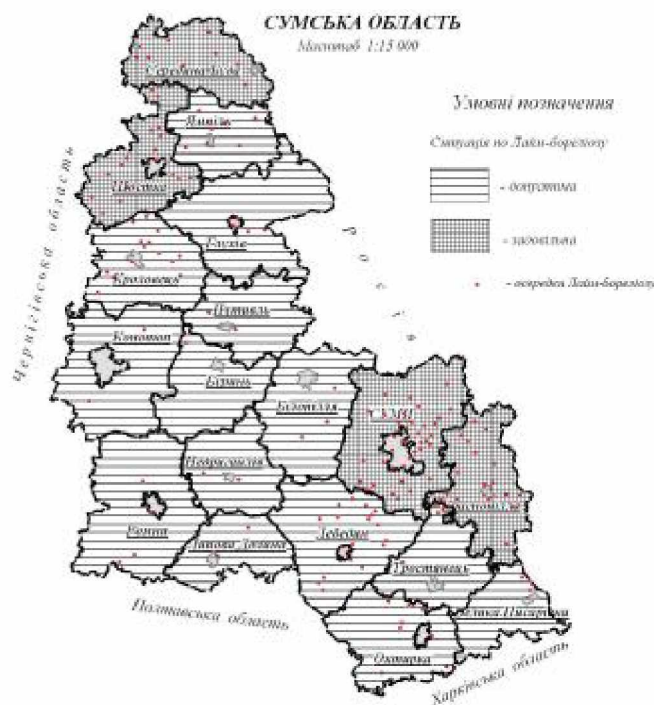
Мал. 3. Ранжування з ЛБ території Сумської області.

активності іксодових кліщів. А саме: це червень-жовтень, при активності кліщів у квітні-червні та кінці серпня-вересні (мал. 4).