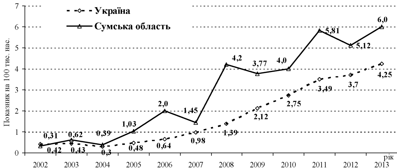
Мал. 1. Динаміка захворюваності на ЛБ в Україні та Сумській області за 2002-2013 рр.

З 2002 по 2013 рр. спостерігається позитивний абсолютний приріст інцидентності за винятком 2004, 2007, 2009 та 2012 років. За останні 10 років встановлена виражена тенденція до зростання захворюваності на ЛБ ( T_{\text{пр. сер.}} = + 9,5 ).