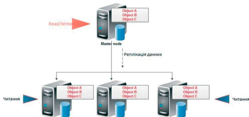
Рис. 2. Peer-to-peer реплікація

акцент на великий обсяг даних, а інші — на велику кількість зв'язків, в яких зберігається не тільки текстова інформація, а й зображення, тому важливо доробляти систему та оптимізувати її вже під конкретне завдання, оскільки створити систему та зробити її максимально простою та універсальною дуже складно. Розглядаючи готові рішення, слід зважувати на ціну, адже, навіть готові програмні продукти потрібно налаштовувати на виконання певних завдань, а в подальшому виділяти кошти та час на підтримку їх функціонування.