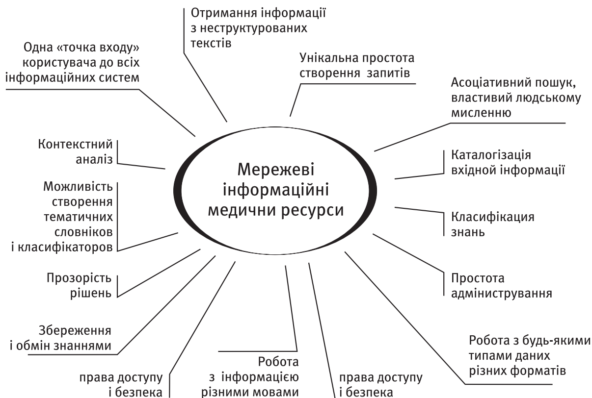
Рис. 1. Узагальнена схема визначення вимог щодо взаємодії лікарів та пацієнтів у сучасному інформаційному середовищі на основі використання змісту МД

Узагальнена схема визначення вимог щодо взаємодії лікарів та пацієнтів у сучасному інформаційному середовищі представлена на рис. 1.