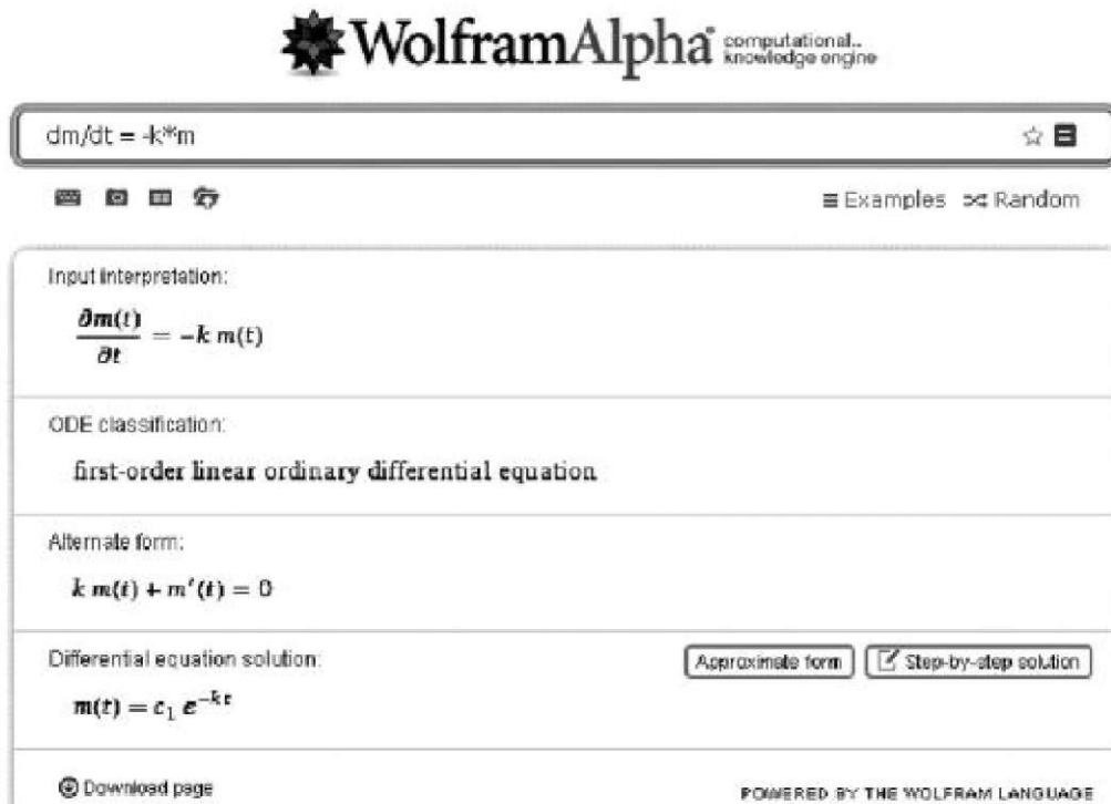
Рис. 2. Розв'язок диференціального рівняння моделі одноразового введення препарату в орган.