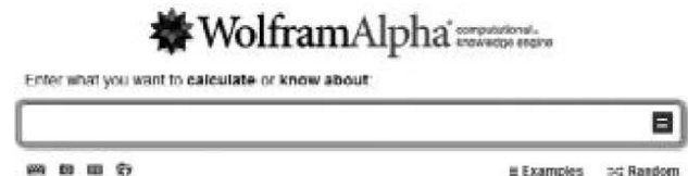
Рис. 1. Інтерфейс WolframAlpha.

Для цього потрібно завантажити ресурс WolframAlpha, можна за адресою http://www.wolframalpha.com (рис. 1).