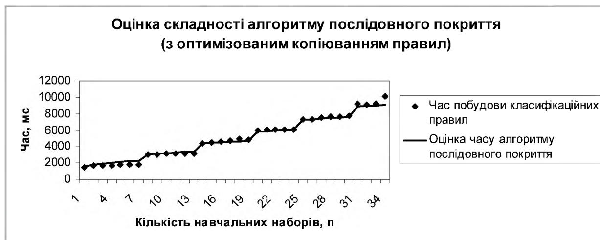
Рис. 2. Порівняння результатів чисельного експерименту на основі оптимізованого копіювання правил з оцінкою складності алгоритму (3).