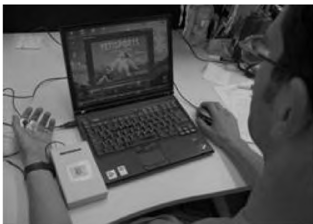
Рис. 2. Вимірювальний блок та виносний пульт системи для біологічного зворотного зв'язку при дії різних корегуючих процедур при розумових дисфункціях.

зіставлення з власними підсвідомими відчуттями, а також знімає певну невизначеність результату впливу. Ми використали ці прийоми для біологічних зворотних зв'язків при застосуванні відомих методів сегментарно-рефлекторного і точкового масажу [4, 5] на тригерні зони голови [13]. Ми пропонуємо застосовувати методи об'єктивної оцінки дії масажу за змінами температури та електричних потенціалів в активних зонах шкіри (АЗШ) голови [11, 13]. На цих принципах була розроблена система із біологічним зворотним зв'язком, що дозволяє людині по зоровому чи звуковому каналу оцінити ступінь збудження чи гальмування своєї нервової системи, у тому числі і дію масажу чи самомасажу [13] (рис. 2). Застосована система вимірює зміни температури та статичних електричних потенціалів (СТЕП) шкіри голови в активних зонах шкіри (АЗШ), частоти серцевих скорочень та опору шкіри при масажі, від змін цих значень спрацьовують порогові пристрої [12, 13], що викликає зміну тону звуку у навушниках чи світлової сигналізації (рис. 2, 3).