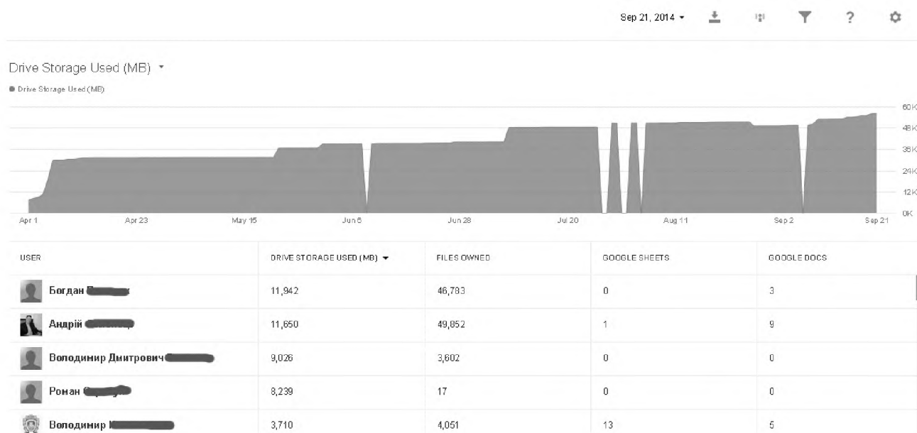
Рис. 1. Графік росту використання обсягу дискового простору в сервісі Google Drive ТДМУ протягом 2–3 кварталу 2014 року.

Якісні зміни в процесі діловодства вимагають більш тривалого часу та не лише накопичення “критичної маси” електронних документів, а й розширення переліку активних користувачів хмарних сервісів.