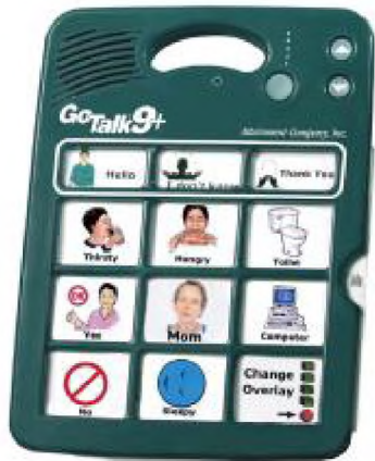
Рис. 1. Прилад GoTalk.

У світі існує кілька високотехнологічних і багатофункціональних засобів для спілкування людей, які втратили можливість говорити і/або рухатися. Але є два основних бар’єри при їх застосуванні. Перший полягає у необхідності мати спеціальні знання і вміння користуватися комп’ютерними програмами, їх необхідно вміти встановлювати та налаштовувати. Друге обмеження – висока вартість. Частина з таких програмних засобів призначена для перетворення тексту в голос [5, 6].