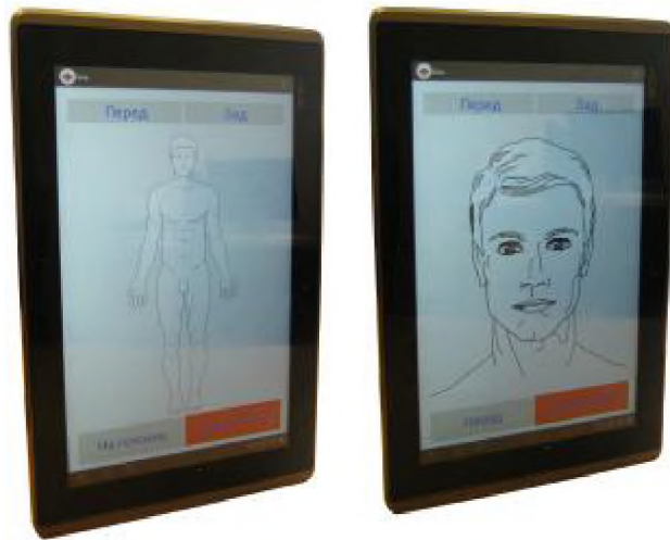
Рис. 3. Вікна вибору місця болю.

Слід зауважити, що інформаційний комунікатор запам'ятовує для кожного хворого історію болю і ділян-