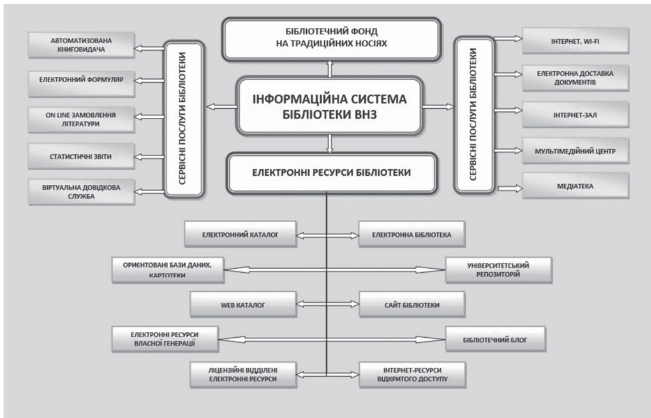
Рис.4. Типова інформаційна система бібліотеки ВМ(Ф)НЗ.

Основні характеристики автоматизованої бібліотеки ВМ(Ф)НЗ: