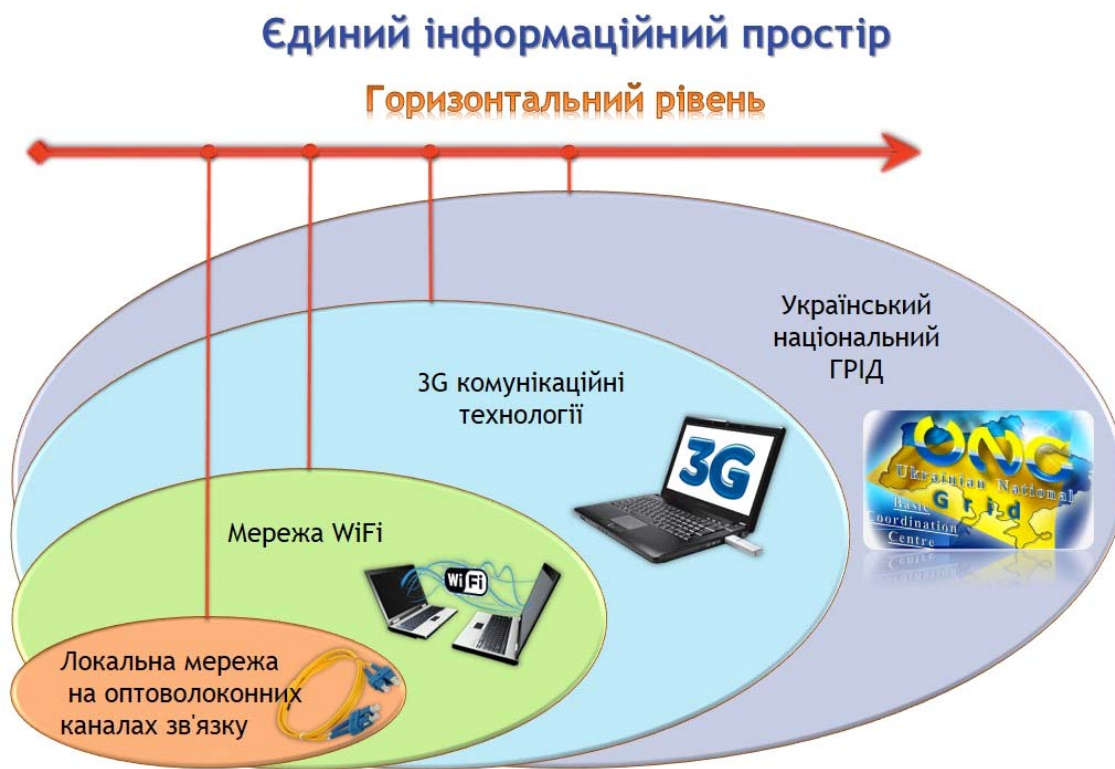
Рис. 2. Горизонтальний базовий рівень структурної організації комп'ютерних мереж.

Наступний, четвертий рівень інтеграції, впроваджується у випадку необхідності проведення великого обсягу наукових обчислень, це підключення серверного кластера університету до ГРІД-мережі (система кластерів високопродуктивних серверів наукових та навчальних закладів України, об'єднаних високошвидкісними мережами у багато процесорний суперкомп'ютер).