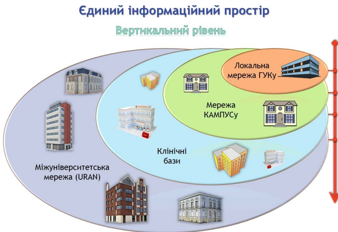
Рис. 1. Вертикальний базовий рівень структурної організації комп'ютерних мереж.

Результати та їх обговорення. Розглянемо детально структурну організацію комп'ютерних мереж (КМ) ВМ(Ф)НЗ (рис. 1).