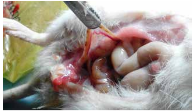
Рис. 1. Макроскопічна картина маткового рога щура дослідної групи.

У всіх щурів дослідної групи виявлено припинення розвитку вагітності. Макроскопічно в рогах матки виявлено потовщення та крововиливи в місцях, де, за припущенням, відбувалася імплантація (у щурів кількість вагітностей може доходити до 4–6 в кожному розі матки). Макроскопічна картина представлена на рисунку 1.