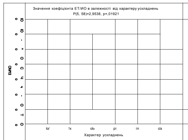
Рис. 3. Залежність значення коефіцієнта ЕТ/ІО від характеру ускладнень пневмонії дітей (об - обструктивний синдром; кш - кардіоваскулярний синдром; рі - плеврит; сів - деструкція; 1х - токсикоз; іп - інші).

ВИСНОВКИ. 1. Перебіг позагоспітальної пневмонії у дітей характеризується розвитком ендотеліальної дисфункції, що зумовлено порушенням співвідношенням між вазоконстрикторами та вазодилататорами, а зокрема більш вираженим збільшенням ендотеліну-1 порівняно із зростанням метаболітів оксиду азоту, що призводить до розвитку системної вазоконстрикції. Окрім цього зростала кількість циркулюючих ендотеліоцитів, що свідчить про пошкодження ендотелію судинної стінки. Отримані зміни залежать від