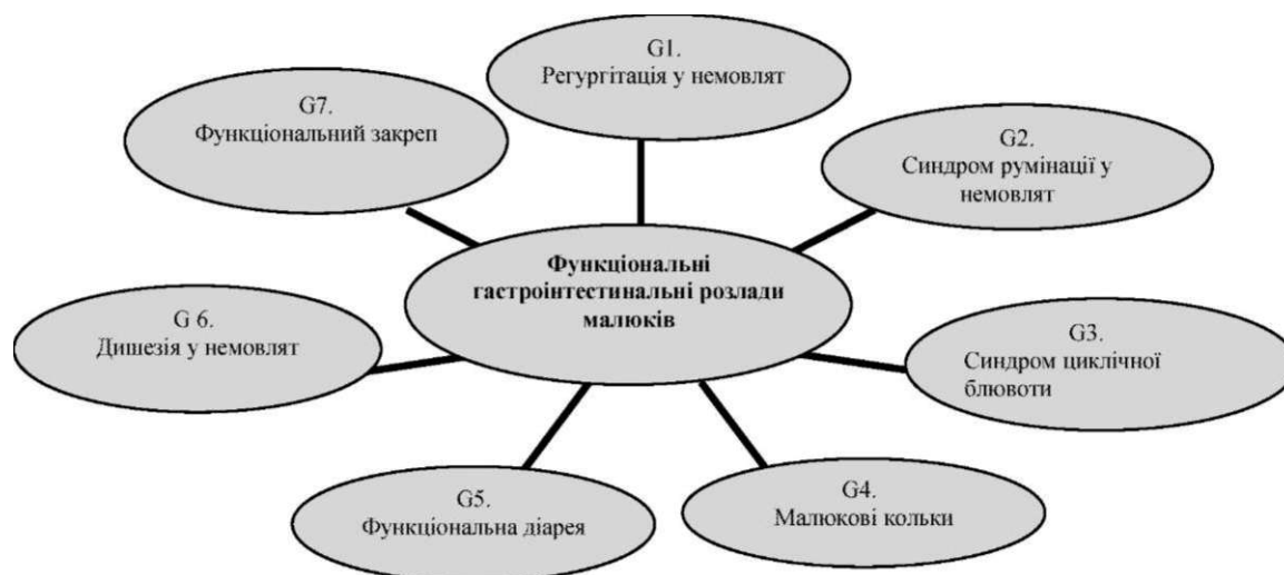
Рис. 1. Функціональні гастроінтестинальні розлади у дітей раннього віку.

Згідно з Римськими критеріями III (2006), виділяють наступні функціональні гастроінтестинальні розлади у новонароджених і дітей раннього віку (рис. 1):