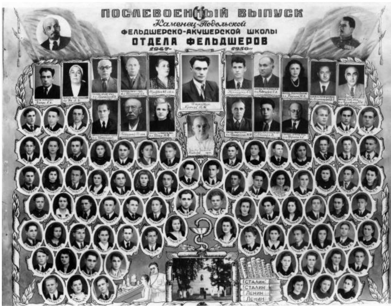
1947–1950 рр. – Кам'янець-Подільська фельдшерсько-акушерська школа