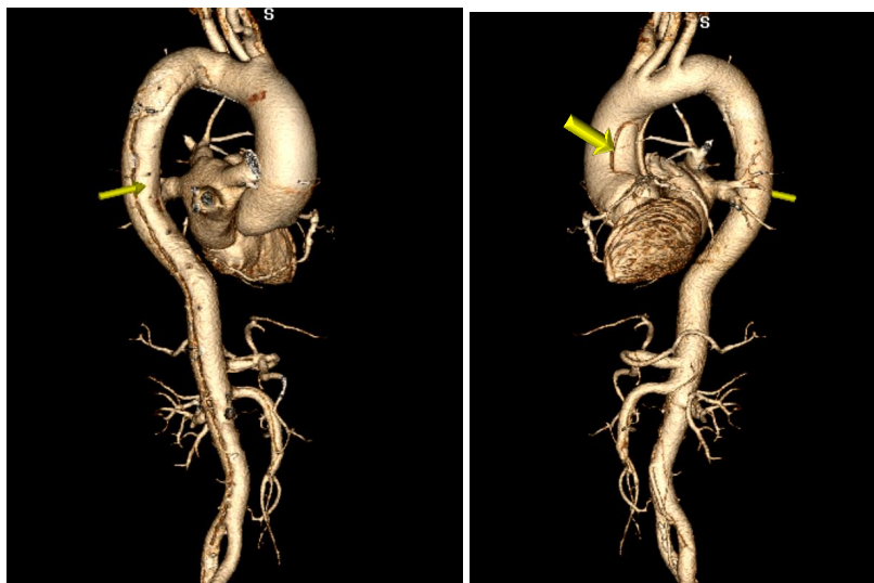
Рис. 1. Комп'ютерна томографія в ангіорежимі грудної та черевної аорти. 3-D реконструкція. ГРАА типу А. Лінію розшарування позначено стрілками. Дані НІССХ ім. М. М. Амосова НАМН України.